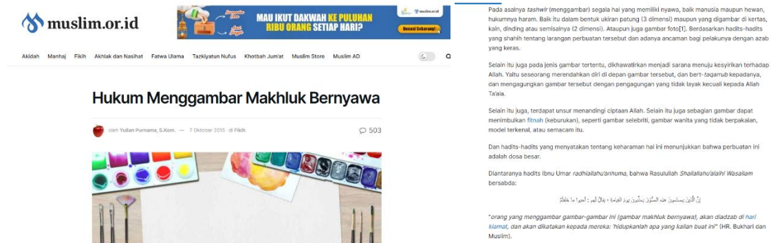
Gambar 3. Tampilan artikel "Hukum Menggambar Makhluk Bernyawa"

khalaqtum " (dikatakan kepada mereka: "hidupkanlah apa yang kalian buat") ditafsirkan sebagai bentuk ejekan ilahiah terhadap tindakan meniru penciptaan Allah. Dalam narasi ini, hadis bukan hanya dijadikan sumber normatif, melainkan juga direproduksi sebagai media retorik untuk membangun ketakutan dan kehati-hatian umat dalam praktik visual. Penulis juga membedakan antara gambar makhluk bernyawa dan gambar objek tak bernyawa, seraya mendasarkan penjelasan ini pada pendapat Ibnu Abbas dan konsensus sahabat. Strategi ini menunjukkan upaya sistematis untuk memperkuat otoritas larangan, sambil tetap memberi ruang teknis bagi jenis seni visual yang dianggap tidak melanggar batas syar'i.