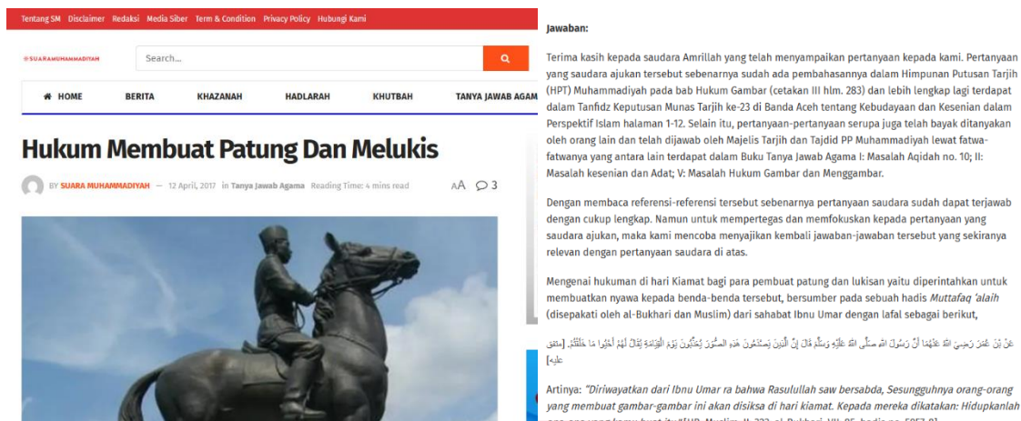
Gambar 3. Tampilan artikel "Hukum Membuat Patung dan Melukis"