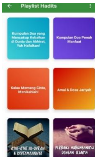
Gambar 3. Playlist Hadis

playlist yang ada didasarkan pada beberapa tema tertentu. Hal ini memudahkan bagi pengguna untuk melacak kembali hadis yang hendak dibaca