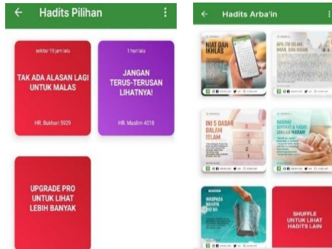
Gambar 1. Tampilan Hadis Arba'in dalam Aplikasi

Kedua , fitur poster hadis dan kartu ucapan. Hampir sama dengan fitur sebelumnya, namun bentuk visual dari fitur ini menggunakan bentuk poster dengan desain yang cukup menarik dan iconic serta menarik bagi para pengguna, karena sangat relevan dengan kehidupan sehari-hari. Dengan fitur ini, seseorang bisa mendistribusikannya kepada khalak luas, sehingga semua bisa memahami isi dari konten yang disediakan. Sementara itu, fitur kartu ucapan berisi konten hadis pada aplikasi ensiklopedia hadis 9 imam berupa meme dakwah yang berisikan konten ucapan, di antaranya meliputi ucapan bulan muharram, ramadhan, idul fitri, kemudian ada juga ucapan atas kelahiran anak dan ucapan untuk pernikahan.