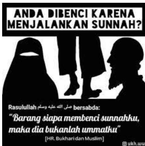
Gambar 5. Meme Hadis

ulama' terdahulu dalam menerima setiap hadis yang berkembang di tengah masyarakat (al-Sibā'ī, n.d.). Ada serangkaian tahapan verifikasi sebelum seseorang mengamalkan hadis atau menjadikannya sebagai landasan kritis dalam membentuk pola fikir keagamaan. Selain itu, pemaknaan hadis yang berkembang di media sosia (bagian dari platform digital) seringkali muncul dari pola fikir yang beragam. Perbedaan akidah, fiqh, dan nalar keberagaam turut mempengaruhi makna yang muncul. Misalnya dalam meme tentang "sunnah", disebutkan bahwasanya orang-orang yang membenci sunnah bukan termasuk bagian dari nabi.