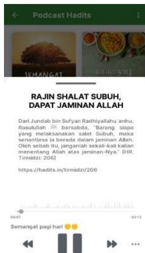
Gambar 4. Podcast Hadis

Keempat , fitur podcast hadis. Fitur ini menampilkan konten hadis yang berasal dari aplikasi Ensiklopedia Hadis 9 Imam dengan menampilkan audio seorang narrator yang membacakan hadis 4-5 hadis sesuai playlist tema hadis yang tersedia. Bagi beberapa kalangan yang memiliki kebutuhan khusus, fitur ini cukup membantu mereka untuk bisa mempelajari hadis nabi.