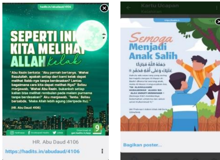
Gambar 2. Poster Hadis dan Kartu Ucapan

Kedua , fitur poster hadis dan kartu ucapan. Hampir sama dengan fitur sebelumnya, namun bentuk visual dari fitur ini menggunakan bentuk poster dengan desain yang cukup menarik dan iconic serta menarik bagi para pengguna, karena sangat relevan dengan kehidupan sehari-hari. Dengan fitur ini, seseorang bisa mendistribusikannya kepada khalak luas, sehingga semua bisa memahami isi dari konten yang disediakan. Sementara itu, fitur kartu ucapan berisi konten hadis pada aplikasi ensiklopedia hadis 9 imam berupa meme dakwah yang berisikan konten ucapan, di antaranya meliputi ucapan bulan muharram, ramadhan, idul fitri, kemudian ada juga ucapan atas kelahiran anak dan ucapan untuk pernikahan.